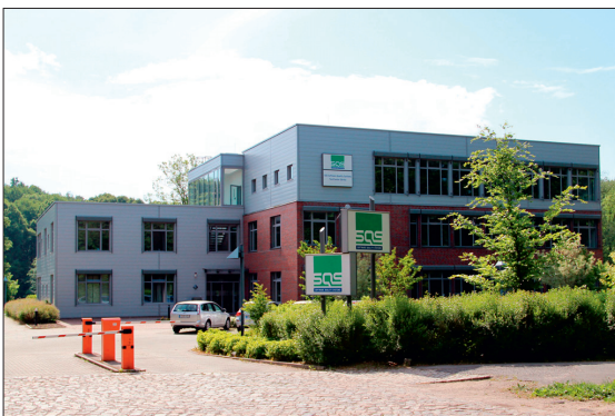
Das SQS-Testcenter in Görlitz

Zum Erfolg trägt auch bei, wenn der Testdienstleister bei der Anwendung von Testwerkzeugen die Standards selbst vorgibt. Anfangs hat SQS noch Testelemente von Kunden übernommen, dies hat sich jedoch nicht bewährt. Stattdessen setzt das Unternehmen nun stringent auf eigene Standards und Tools. Und auf eine weltweite Verteilung der Testcenter, denn die Kunden sollen mit ihren Ansprechpartnern stets in ihrer Muttersprache sprechen können. Während die SQS-Testcenter in Belfast, Durban (Südafrika) und im indischen Pune vor allem englischsprachige Kunden bedienen, liegt der Schwerpunkt in Görlitz und Kairo auf Deutsch.